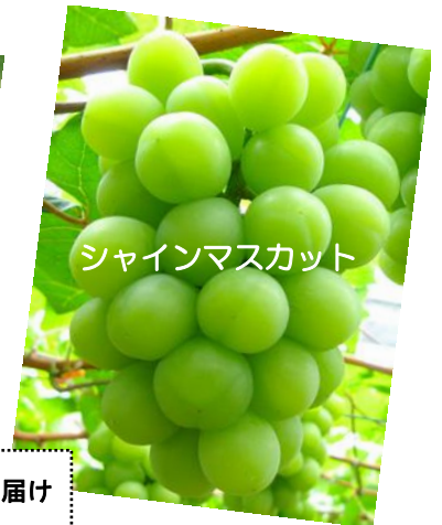
シャインマスカット