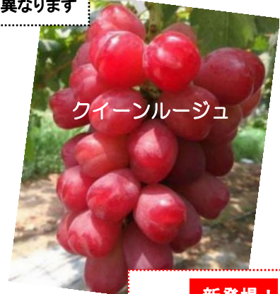
クイーンルージュ